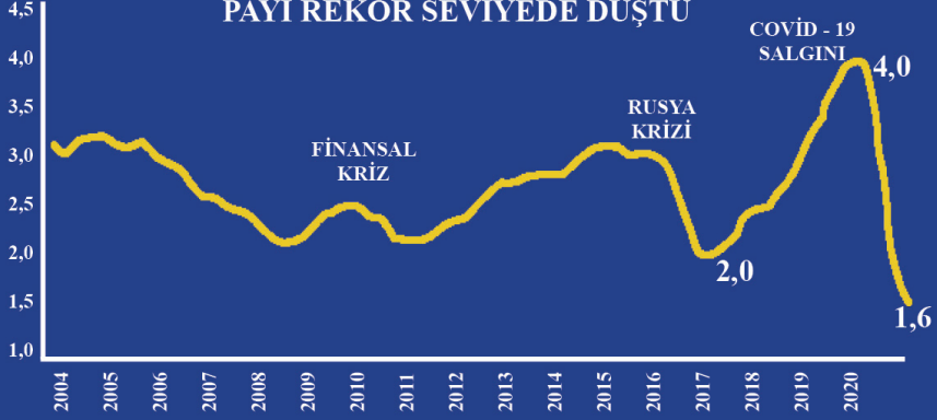
Grafik:1- Turizm gelirlerinin GSMH içindeki payları (2004-2020).

Bilindiği gibi ülke ekonomisinin uzun zamandır içerisinde bulunduğu kriz hali, pandemiyle birlikte çok daha derinleşmiştir. Tam da bu noktada, turizm sektörü belirleyici bir önem kazanmaktadır.