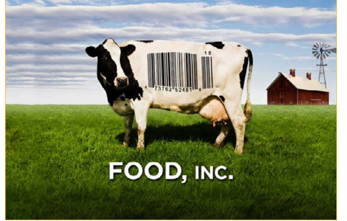
Fotoğraf: "Food, Inc" (Gıda A.Ş.) belgeseli afişinden alınmıştır.

Gıda rejimi kavramı, neoliberal küresel gıda sisteminin farklı biçimlerindeki hegemonyasının karmaşık ilişkilerini kolaylaştırma konusunda bizlere imkan sunmaktadır. Son yüzyıl boyunca dünya tarımsal ticaret hacmindeki büyüme, tarımsal emtia ihracatının 19. yüzyılın ortasında birkaç milyon tondan, 21.yy başında 1.4 milyar tona yükselmesi tarımda muazzam sermaye birikiminin olduğunu göstermektedir. Neoliberal gıda sisteminde ticaret akışlarının boyutu ve özellikleri, arazinin kullanımı, toprağın verimliliği ve en önemlisi tarımsal üretimin ve tüketimin biçimi ulusal gıda rejiminin nasıl oluştuğunu analiz etmek açısından temel ölçeklerdir. Gıda rejiminin günümüzde hegemonya haline gelerek tarımda monokültür üretimin ve tüketimin şirketler tarafından nasıl belirlendiğini nicel ve niteliksel yönleriyle anlatmaya çalışacağız.