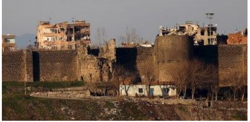
16 Ocak 2016: Güvenlik operasyonları ve güvenlik güçleri ile Kürt militanlar arasındaki silahlı çatışmalarda hasar gören surlar.

Son dönemde Türkiye genelinde kentlerde yürütülen kentsel gelişim planları aynı zamanda hükümetin benimsediği zarar verici sürece de işaret etmekte. 6 Etkilenecek olan kesimlere danışmadan ya da uygulamaların toplumsal ve kültürel sonuçlarını dikkate almadan yapılan tepeden inme planlamalarla, tarihsel mahallelerdeki halkın yasal tapulu mülkleri, İstanbul'un Sulukule, Tarlabası ya da Ayvansaray mahallelerinde olduğu gibi, kentsel yenilenme adı altında yerle bir ediliyor. Tüm bu örneklerde, kentsel gelişimin hedeflediği bölgeler, tarihsel olarak Roman ve Kürt nüfusun yaşadığı bölgelerdir. Plancılar, geliştiriciler bu mahallelerde yerli halkın karşılayamayacağı kadar fahiş projeler yaparak, buraların asıl sahipleri olan düşük gelirli aileleri mahallelerini terk etmeye zorladılar. Sahibi oldukları mülkün şişirilmiş fiyatlarını ya da geliştirilen projelerin maliyetlerini karşılayamadıkları için üçüncü taraflara satış olanağı da olmayan bu aileler, kamulaştırma sürecini yaşamamak için çaresiz mahallelerini terk ediyorlar. Sonuçta, daha da yoksullaşıyor, yoksunlaşıyor, yerlerinden ediliyorlar.