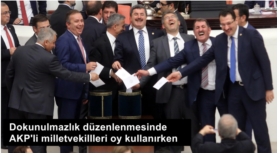
Dokunulmazlık düzenlenmesinde AKP'li milletvekilleri oy kullanırken

Türkiye tarihi boyunca, darbe kurumlarının yerleşmesi veya çoğunluk tarafından Anayasa'yı delmek için bir araç olarak kullanılan geçici maddeler, bu sefer de Anayasa ve İçtüzük tarafından sağlanan hak ve güvencelerin ortadan kaldırılması için kullanılmıştır. İktidar, CHP ve HDP'nin ilkel ve kalıcı bir biçimde, ulusla-