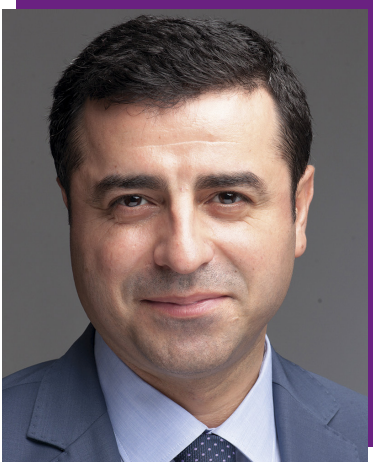
SELAHATTİN DEMİRTAŞ EŞ GENEL BAŞKAN VE İSTANBUL MİLLETVEKİLİ