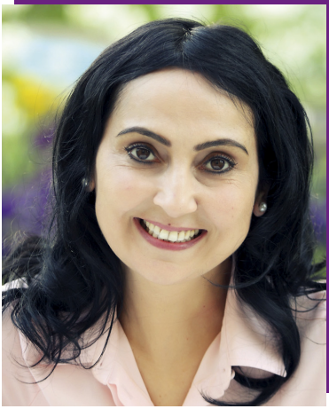
FİGEN YÜKSEKDAĞ EŞ GENEL BAŞKAN VE VAN MİLLETVEKİLİ